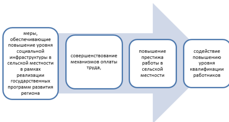
Рисунок 2 – Основные направления государственного регулирования кадровой безопасности АПК в части их совершенствования

Все направления государственного регулирования кадровой безопасности должны опираться на основные принципы обеспечения кадровой безопасности, одним из которых является такой принцип, как кадраосбережение.